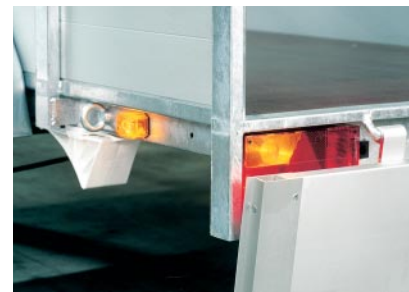
Verlichting zichtbaar bij open achterklep

Veiligheid staat hoog in het vaandel bij Anssems Aanhangwagens BV. Als het om veiligheid gaat telt niet alleen de stevige constructie van de aanhangwagen, maar is het vooral ook van belang om goed zichtbaar te zijn voor andere weggebruikers. Om dat te bereiken is de verlichting, die volgens EG-richtlijnen wordt gemonteerd, uitgebreid met zijmarkeringslichten. Deze lichten zijn veel beter te zien dan reflectoren. Bovendien is in het ontwerp rekening gehouden met het feit dat men ook gezien moet worden als de achterklep open is. Moet u bijvoorbeeld in het donker laden met open achterklep, dan zijn de alarmlichten toch nog zichtbaar. Met een aanhangwagen van Anssems wordt u gezien, en dat is wel zo'n veilig idee.