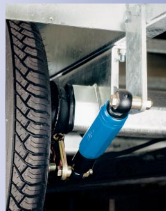
Asschokbreker gemonteerd (optie)

De aluminium borden ten slotte bieden naast het geringe gewicht nog één groot voordeel. Aluminium verkleurt niet, zelfs niet na jarenlang intensief gebruik. Zo blijven onze aanhangwagens er altijd netjes uitzien. Kortom: met aanhangwagens van Anssems mag u gezien worden!